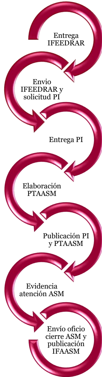
Figura 2. Proceso ASM.