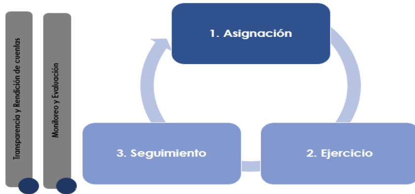
Ejemplo: “Modelo General de Procesos”

Nombre del Fondo: Siglas: Área responsable: Tipo de Evaluación: Año de la Evaluación: Ejercicio fiscal evaluado